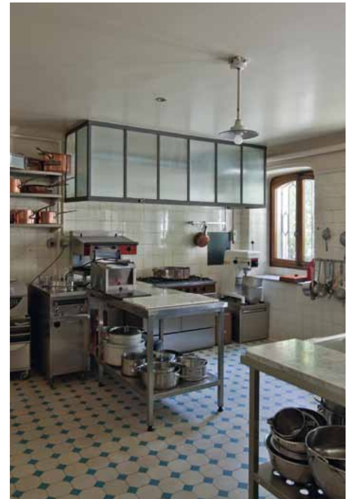
Küche im Untergeschoss