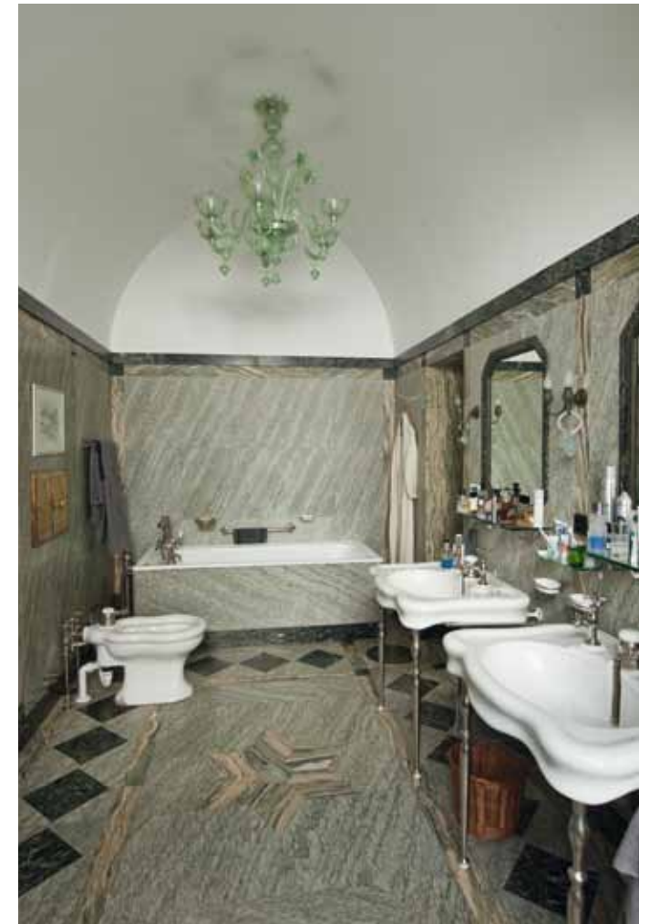
Badezimmer im 1. Obergeschoss