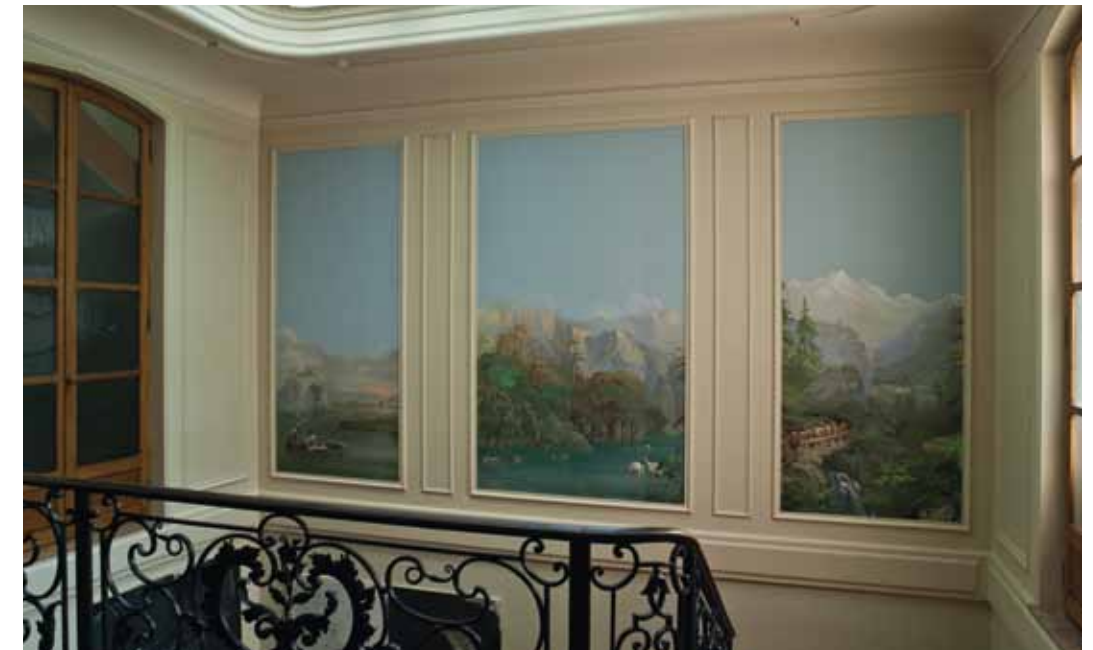
Treppenhaus mit Rixheimertapeten