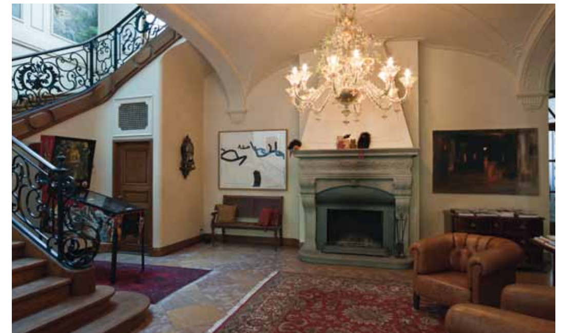
Halle im Erdgeschoss